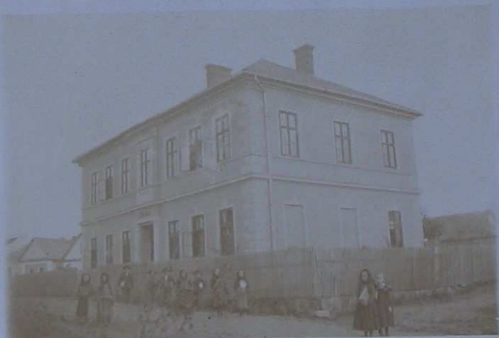
Nová budova školní ve Vys. Poli, vystavěna v r. 1899. a 1900. Počalo se v ní vyučovati dne 16/9. 1900.