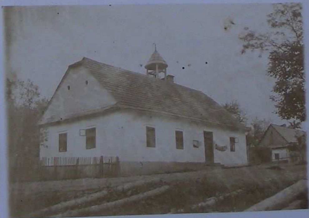
Starší budova školní ve Vys. Poli, v r. 1899.